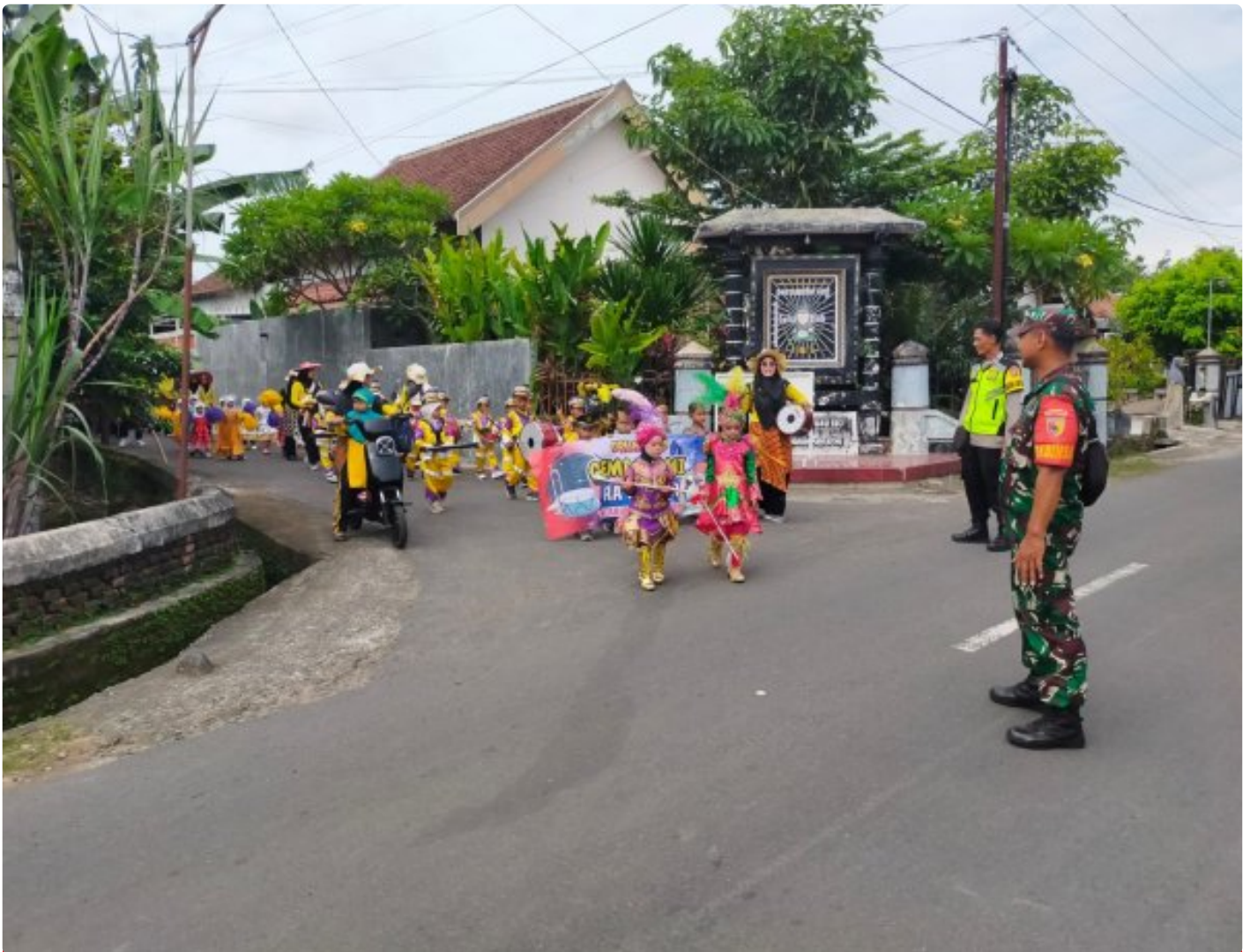
Gebyar Rojabiyah RA dan MI, Babinsa bersama Bhabinkamtibmas Amankan Jalannya Kegiatan Parade Drum Band