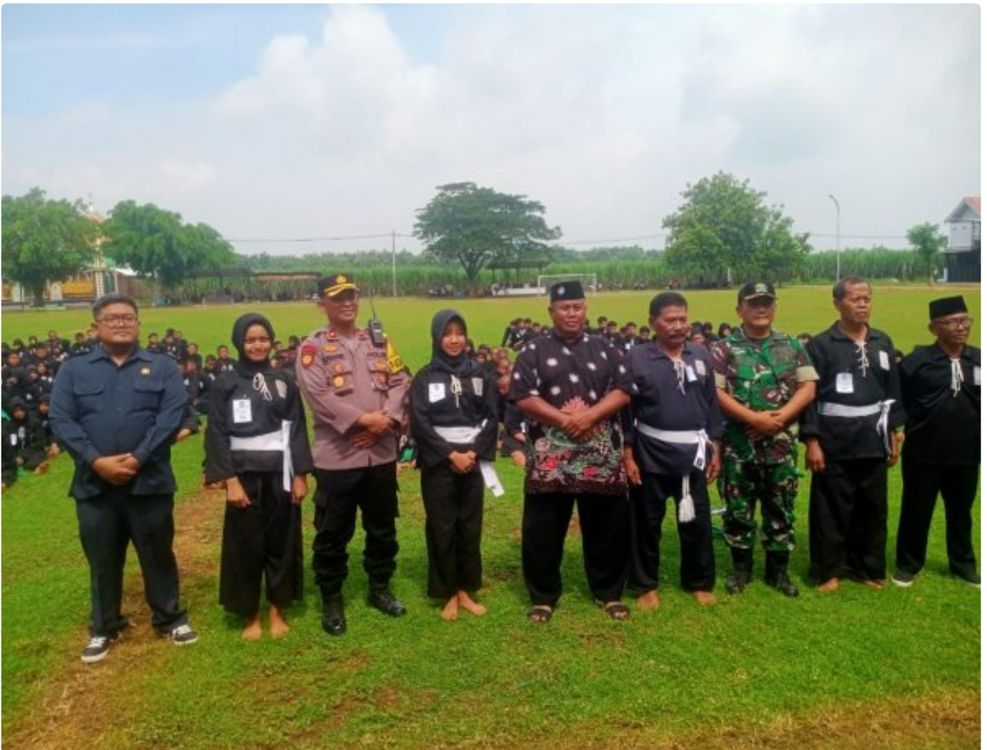
Danramil 0804/06 Maospati Hadiri Tes Kenaikan Tingkat Siswa PSHT Ranting Maospati

Magetan. - Salah satu tahapan yang harus diikuti oleh setiap siswa Persaudaraan Setia Hati Terate (PSHT) sebelum menjadi anggota atau warga adalah mengikuti rangkaian tes kenaikan sabuk.