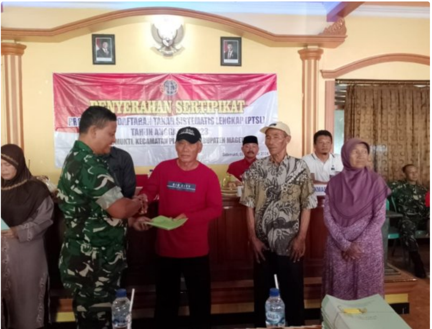
Danramil 0804/02 Plaosan Hadiri Penyerahan Sertifikat Program Pendaftaran Tanah Sistematis Lengkap (PTSL) Desa Sidomukti

PLAOSAN. - Desa Sidomukti melalui Badan Pertanahan Nasional (BPN) melakukan penyerahan Sertifikat Tanah Program Pendaftaran Tanah Sistematis