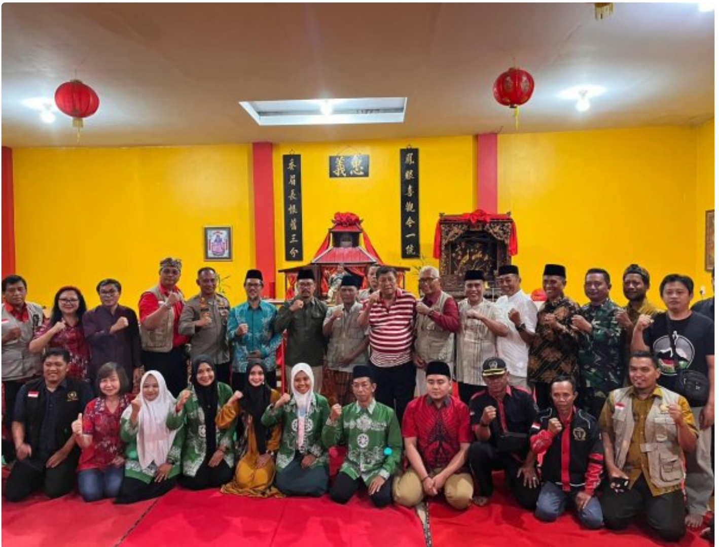
Danramil 0804/01 Magetan Bersama Forkopimca Hadiri Kegiatan Do'a Bersama Peringati Imlek Tahun Baru Saka 2576/2025